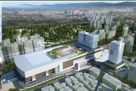
KTX이음(예정) & 부산시민공원