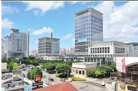
부산시청 행정타운(경찰청, 국세청 등)